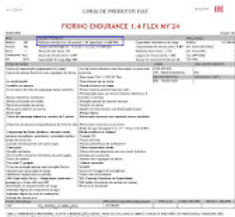
FIORINO 2024 MANUAL.JPG 157K