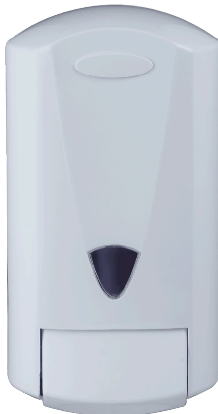
IMAGENS ILUSTRATIVAS DOS PRODUTOS