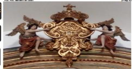
Avançam as obras de restauro da Matriz do Anônimo Dias (Pág. 4)

Prefeitura insubordinar habilitação em Curso para (Pág. 3)